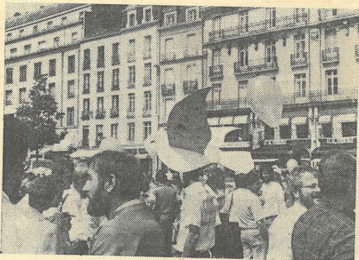
Colombes et ballons flottaient sur la place