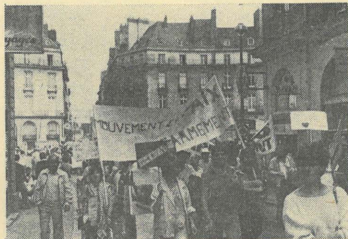
Pour la PAIX, pour la VIE, les jeunes étaient nombreux

Décidément le journal d'Hersant, déjà sourd avant la manifestation de l'Appel des 100, est atteint de cécité depuis celle-ci.