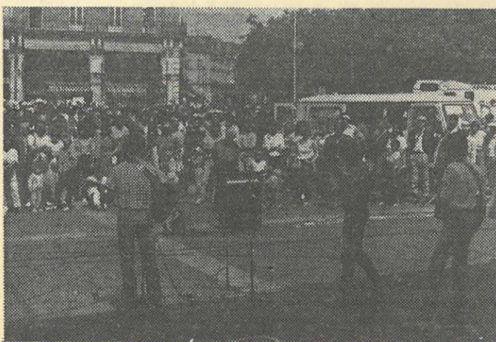
Spectacles sur la place en attendant l'heure du rassemblement