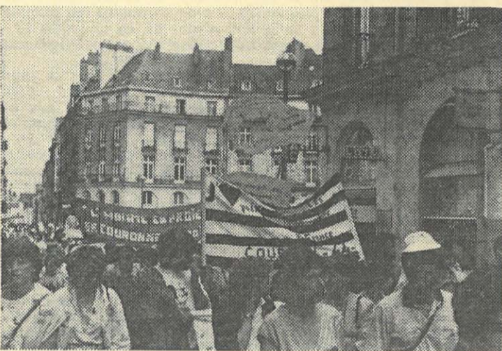
Les pionniers de Couëron précédaient les Etudiants Communistes, clamant avec Eluard : « L'homme en proie à la paix se couronne d'espoir »