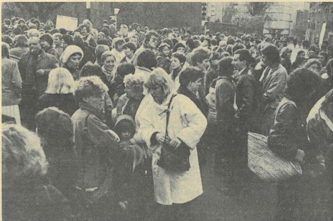
Une très récente manifestation de parents d'élèves devant la mairie

notamment à de nombreuses reprises sur les dossiers économiques agaçant les représentants de droite prétendant au monopole de la compétence en la matière. Refusant de s'enfermer dans la logique de fatalité de la crise, le conseiller communiste situait les responsabilités et démontrait qu'il est possible de faire autrement, mais que pour cela, il fallait rompre avec la sacro-sainte logique capitaliste de la rentabilité financière.