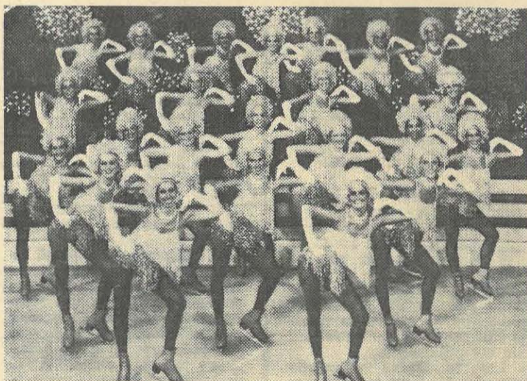
« FASTUEUSES ANNEES 20 », un des clous du spectacle HOLIDAY ON ICE 1984

Événement artistique de la rentrée, Holiday On Ice nous revient, du 2 au 14 octobre à la Beaujoire, avec un spectacle tout nouveau et riche en couleurs.