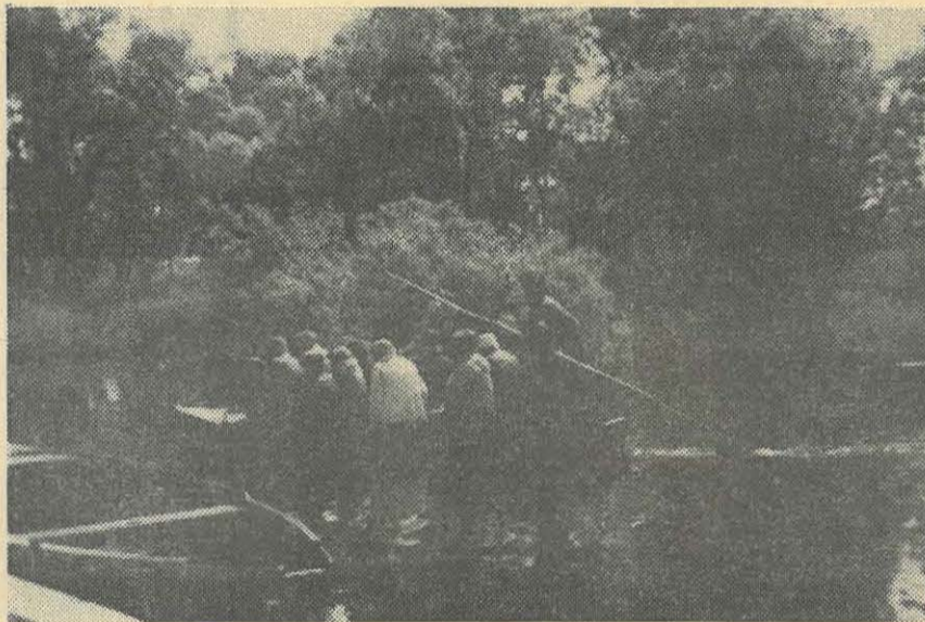
A la découverte de la Brière...

jeux radiophoniques » pour la plus grande joie de tous