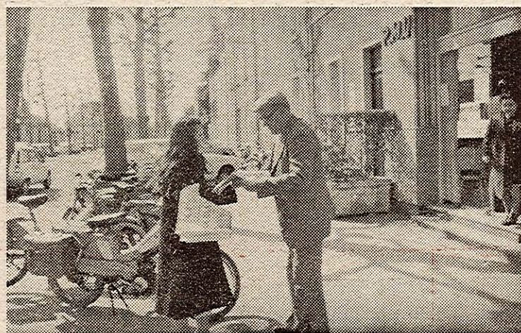
Chaque semaine, ils sont ainsi des dizaines aux portes des entreprises, sur les marchés, au porte à porte, dans les lieux de passage, à diffuser la presse révolutionnaire, la presse de la vérité.

est révolutionnaire et exige une diffusion révolutionnaire qui ne peut être l'apanage d'un nombre limité de camarades à la porte des entreprises, des PMU, des marchés, et au porte à porte. Chaque semaine des résultats encourageants nous tracent le chemin... Continuons.