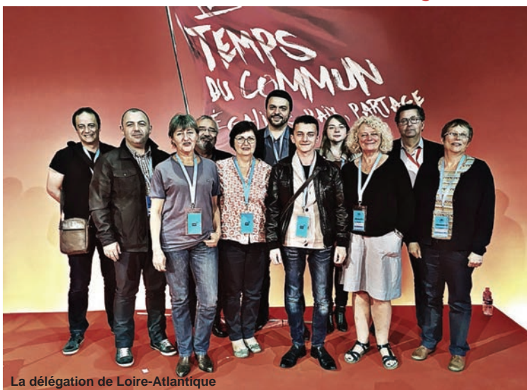
La délégation de Loire-Atlantique

C'est dans ce contexte que les communistes tout au long du week-end se sont dotés d'un relevé de décisions autour des enjeux d'organisation (formation, communication, initiatives financières ...), d'orientations politiques renforcées autour de propositions clefs et d'une « feuille de route » pour 2017 avec l'ambition d'écrire un « mandat populaire » à « des milliers de mains » pour rompre avec les politiques libérales et pour rassembler à gauche.